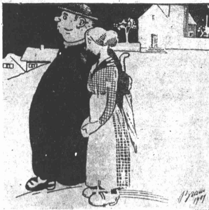
— Filha, no trilho em que segues, andas mal... — Pois eu sigo agora o caminho da Igreja...

Consideraremos, portanto, como nossos assignantes todos aquellos que não devolverem o primeiro numero recebido.